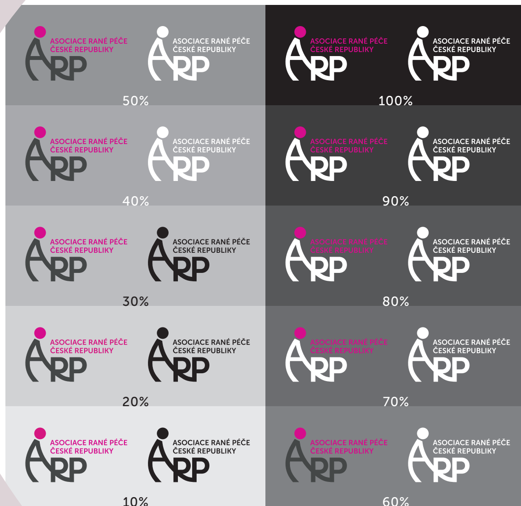
Schéma zobrazuje použití značky v barevné a černé či bílé verzi na podkladové ploše s intenzitou odpovídající 10 – 100% černé. U podkladových ploch s intenzitou, na kterou je možné umístit značku s použitím jiné barvy z manuálu, je tato barva vždy označena.

Na barevném podkladu, který je, byť jen částečně, shodný s některou barvou značky je povoleno použít pouze černou či bílou verzi loga dle intenzity podkladové plochy.